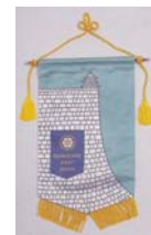
編集 会報雑誌委員会

平成25年7月5日(金) ※7月30日(火)例会変更※ 2013~2014年度 第39年度 第2回 通算第1852回例会 〈丸亀市長表敬訪問〉